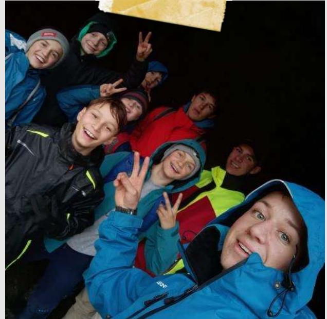
[Text: Raphael Giger]