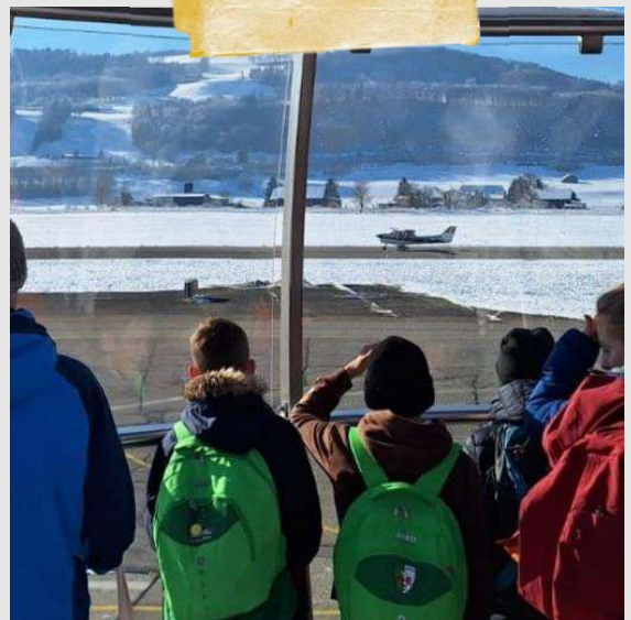
[Text: Janis Stalder]