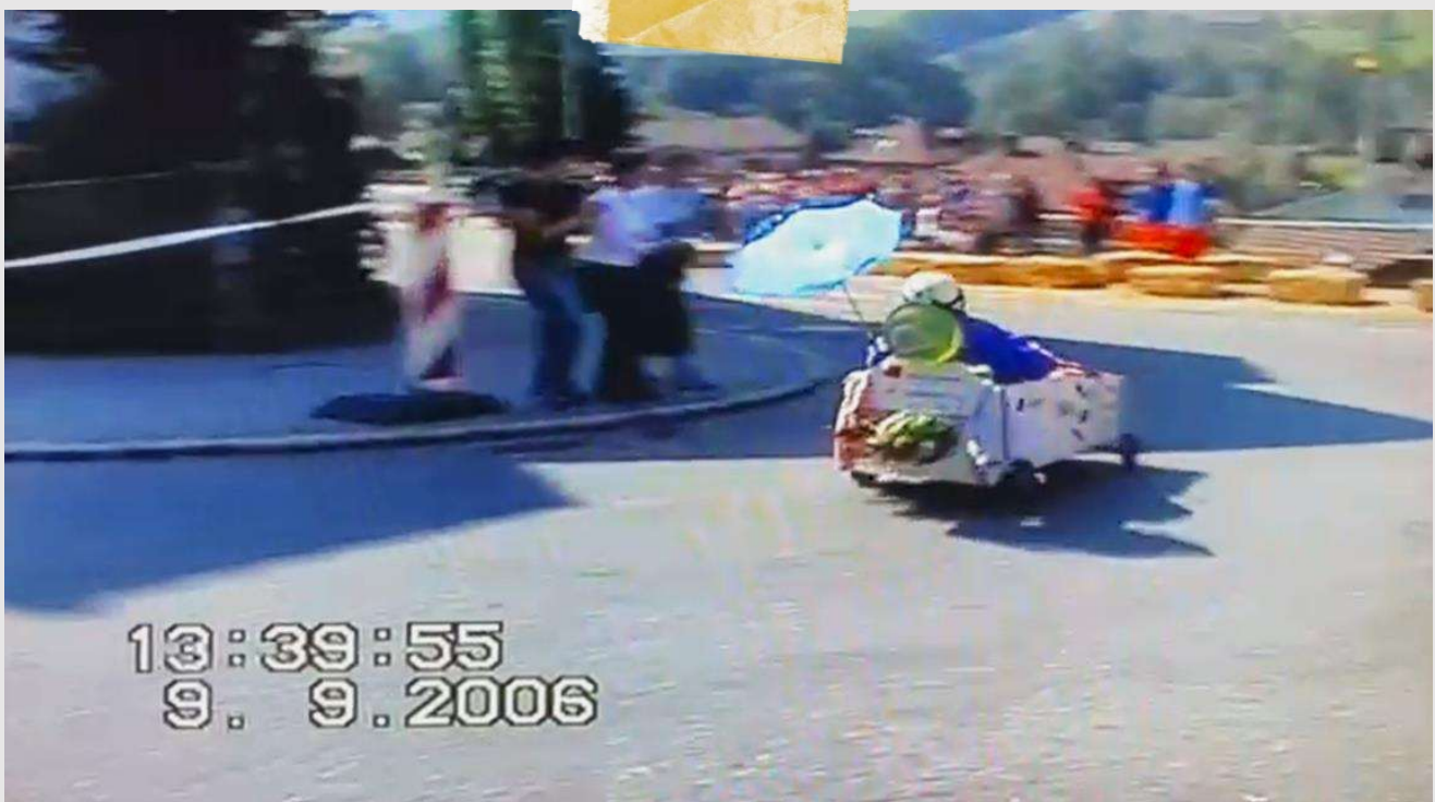
Screenshot aus einem Video vom letzten Seifenkistenrennen [Text: Damian Arnet]

Hast du noch Fragen: melde dich beim OK!