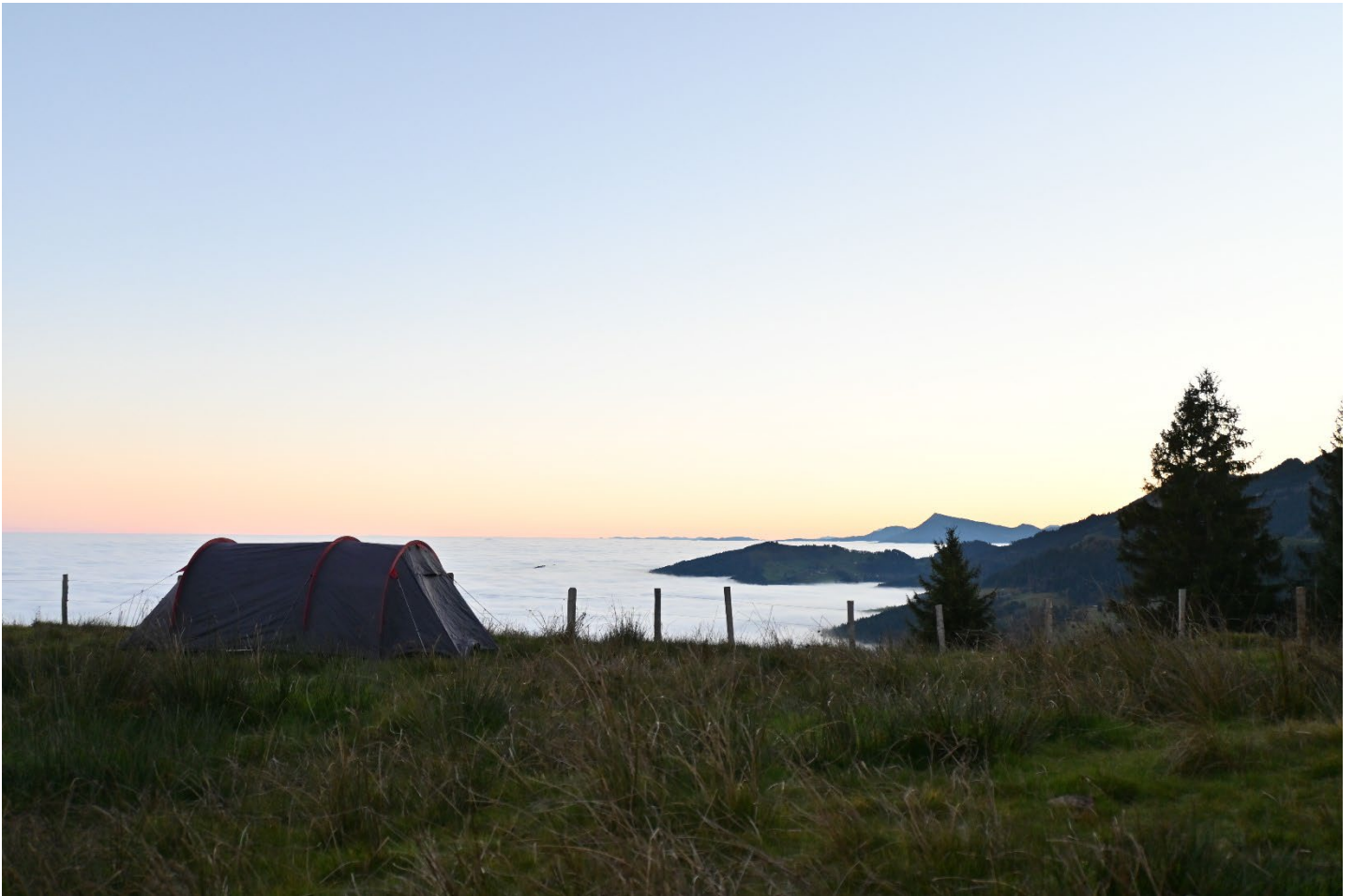
Herbstaktivität der 6. Klasse auf der Alpiliegg.

Die Scharzeitschrift der Jungwacht Entlebuch